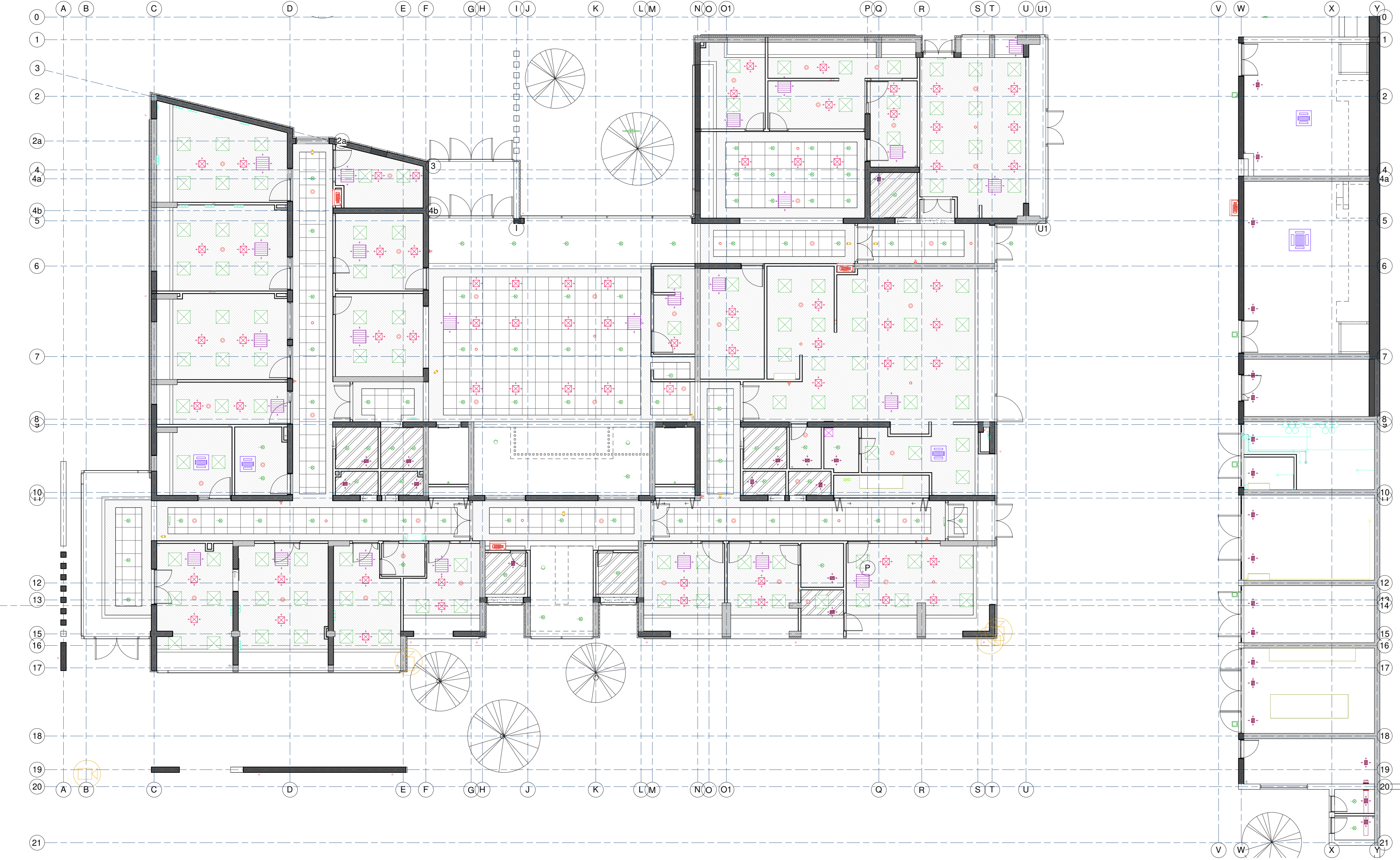
Planta Cielo Reflejado Piso 1 1 : 100